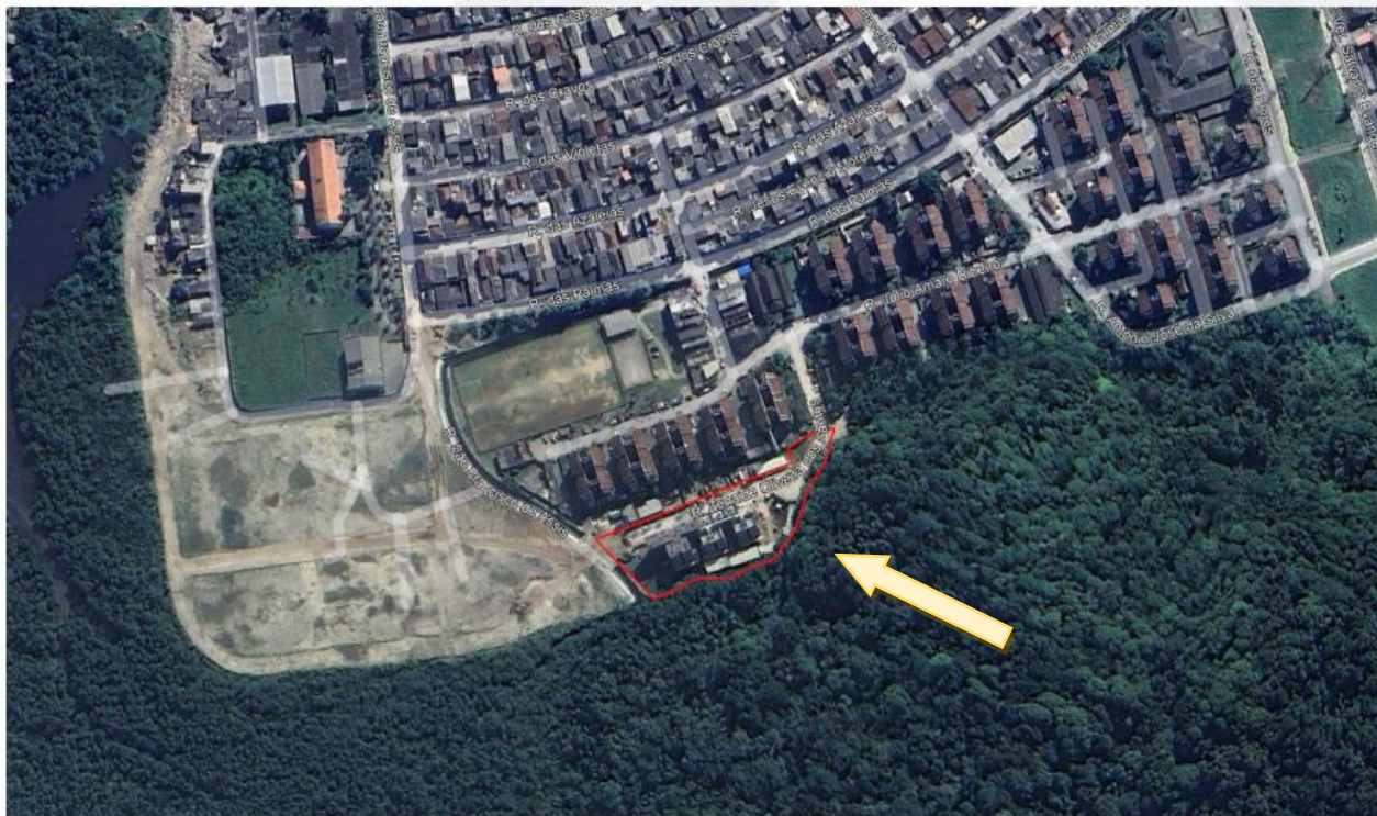
Figura 1. Local do Projeto de Urbanização e Reassentamento de Moradias em Área de Risco e Proteção Ambiental de Vila Esperança - Vila Caic / D. Pedro - Fase 01.

Desenvolvido pela Prefeitura Municipal de Cubatão, o referido Projeto de Urbanização tem como objetivo geral assegurar o direito à moradia adequada e a eliminação de condições de riscos à vida para as famílias residentes na área da Vila Esperança, de forma combinada com ações de recuperação ambiental de importante área de preservação ambiental. Localiza-se no limite Sul do município de Cubatão, paralelo à rodovia Padre Manoel da Nóbrega, entre os trilhos da ferrovia e o manguezal do rio Paranhos. À sudeste da área observa-se vegetação primária, com presença de corpo hídrico à oeste; à norte localiza-se o conjunto habitacional Mario Covas.