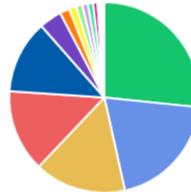
VALOR POR ÁREA DEMANDANTE