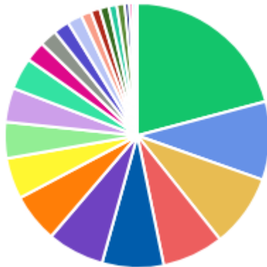
DFDs POR ÁREA DEMANDANTE